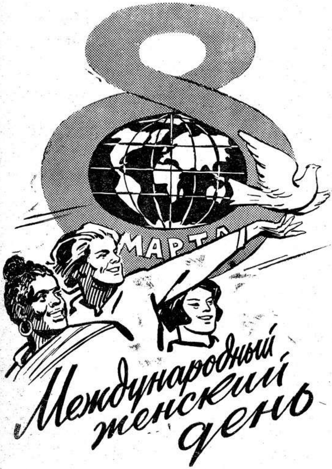
Плакат художника В. Жаринова.