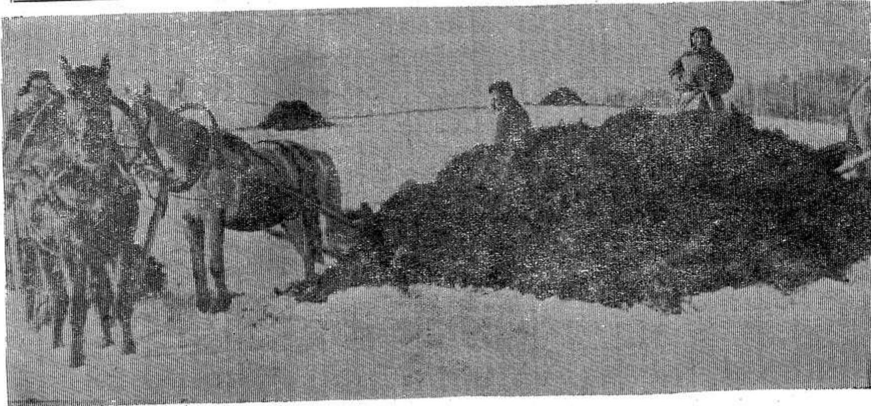
Пятый год семилетки будет урожайным — так решили хлеборобы колхоза им. Мичурина. В артели заложено 5.963 тонны торфо-навозных компостов.

НА СНИМКЕ: члены первой бригады вывозят навоз.