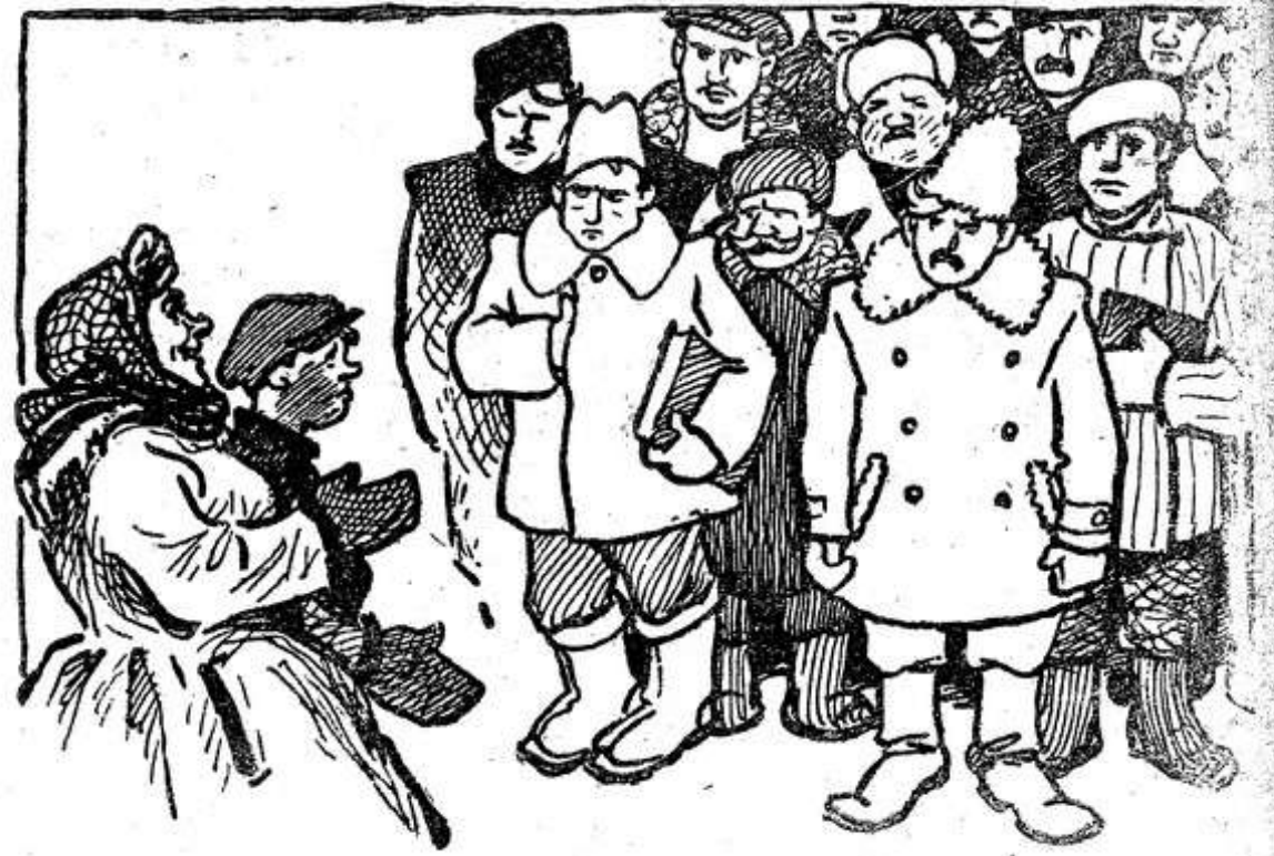
— Товарищи начальники! Не затерялась ли промем вас наша бригада? Рис. К. Елисева.