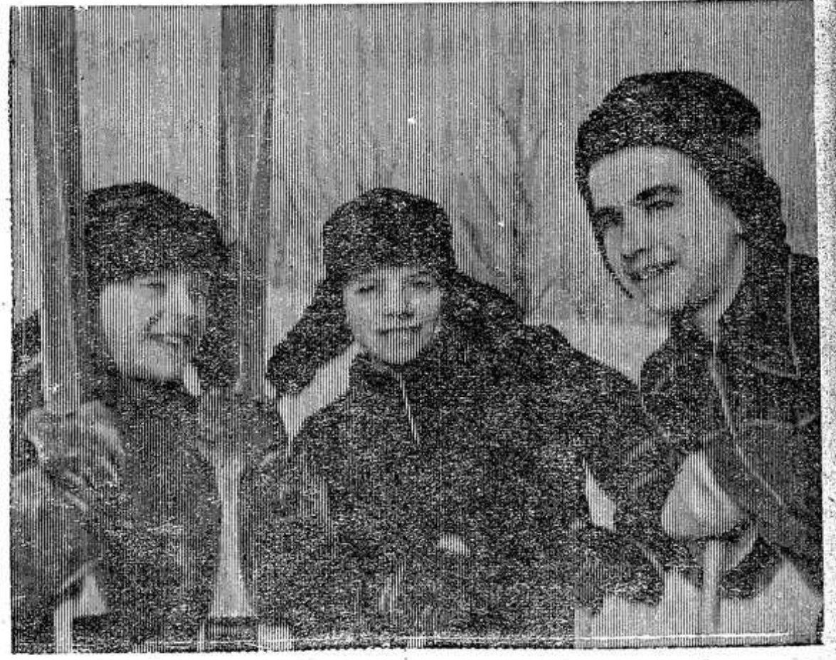
Зима... Хорошо пройтись на лыжах по заснеженному лесу. Но больше всего привлекает ребят Опочецкий вал, где с крутых его гор можно проехать с «ветерком». На валу и запечат-

Итак, по всем этим вопросам ждем от вас, дорогие товарищи, материалов в наступившем месяце!