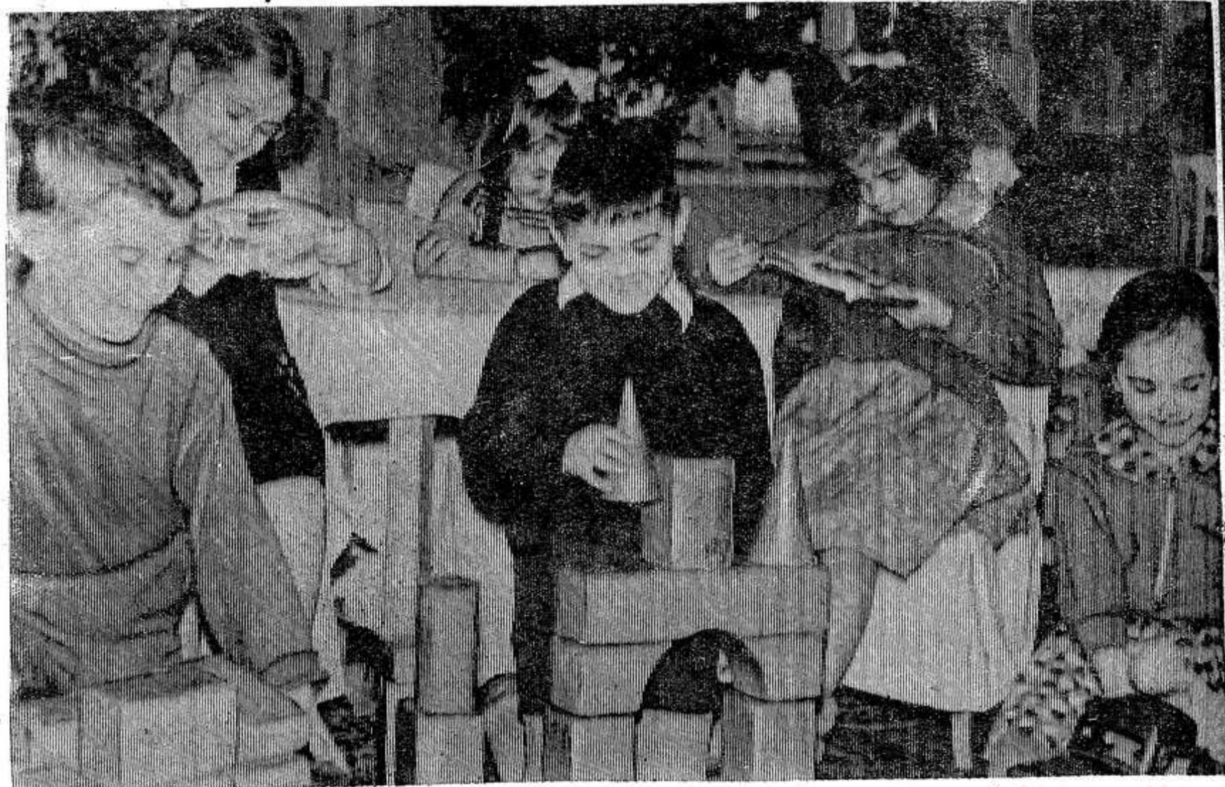
У них счастливое детство. Снимок сделан в Опочечком детском саду № 1.

О. Иванова уборщица Красногородской школы-интерната № 1.