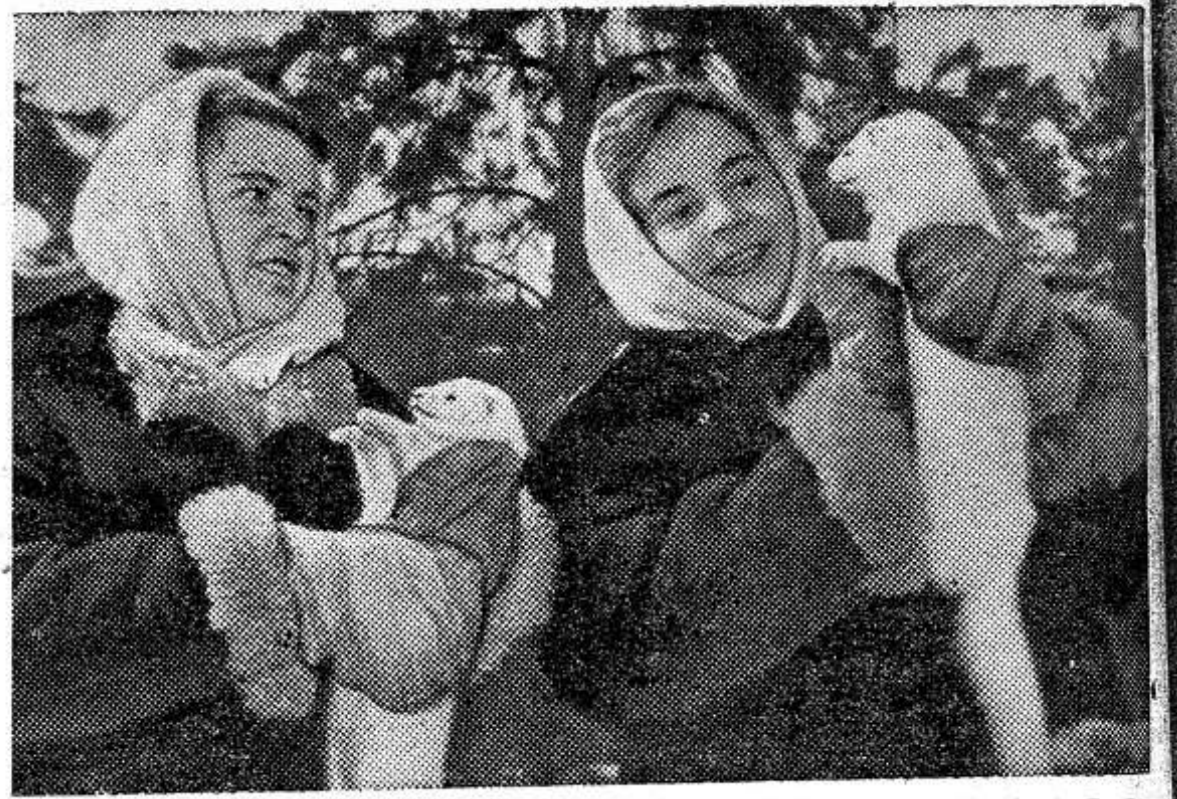
КАРЕЛЬСКАЯ АССР. Зверосовхоз «Пряженский» — самое молодое звероводческое хозяйство в республике.

В 1959 году, когда страна приступила к осуществлению семилетнего плана, в совхоз были завезены первые 600 норок. Сейчас в основном производящем стаде совхоза насчитывается более 6.000 норок — столько, сколько запланировано на последний год семилетки. Пряженская пушнина пользуется большим спросом на международных пушных аукционах. Наряду с норкой в совхозе выращиваются норвежские песцы и серебристо-черные лисицы. В 1962 году совхоз сдал государству пушнины в два раза больше, чем предусматривалось планом.