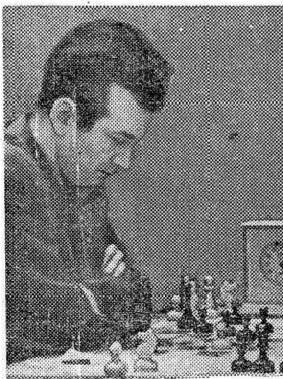
НА СНИМКЕ: В. Корчной.

☆ Матч на первенство мира по шахматам между чемпионом мира Михаилом Ботвинником и гроссмейстером Тиграном Петросяном начнется в Москве 22 марта 1963 года. Для сохранения почетного титула Ботвиннику из 24 партий достаточно набрать 12 очков, Петросяну, чтобы стать чемпионом мира, нужно получить 12,5 очка.