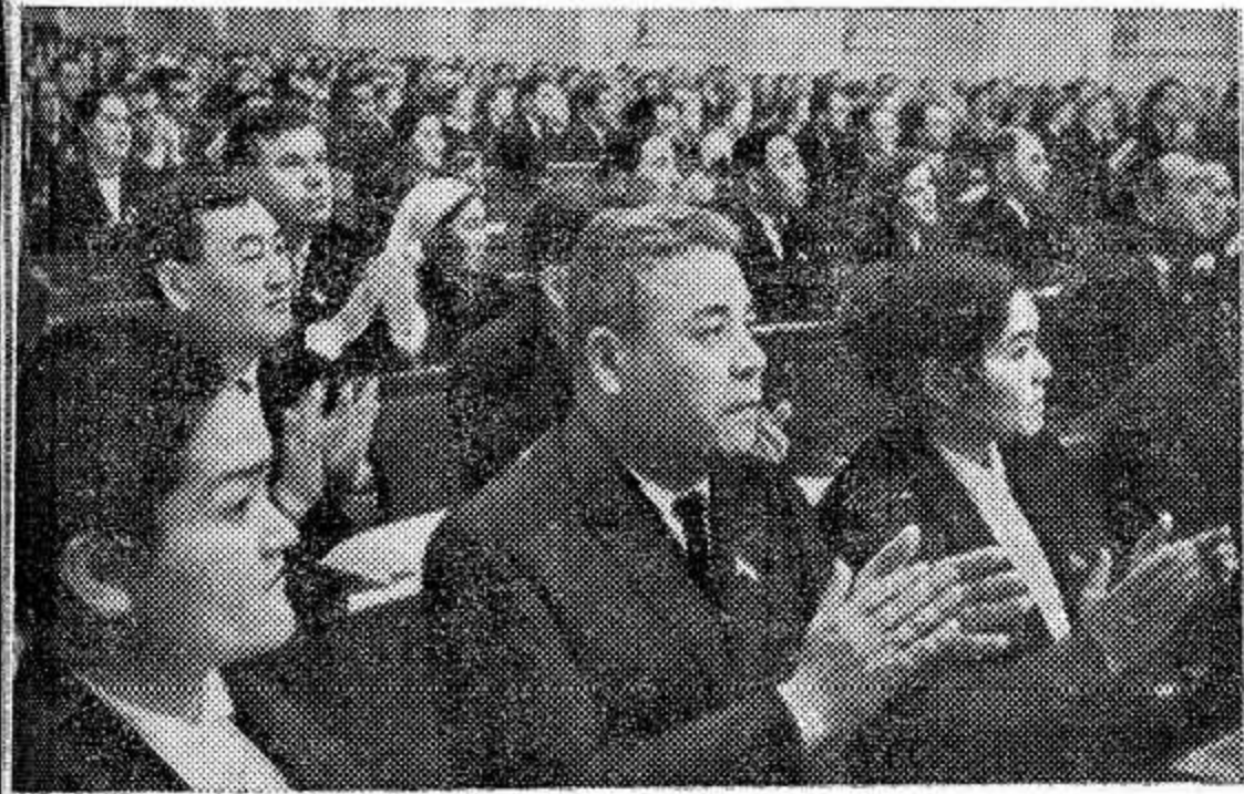
Москва. 10 декабря в Кремле открылась вторая сессия Верховного Совета СССР шестого созыва. На снимке: во время заседания.