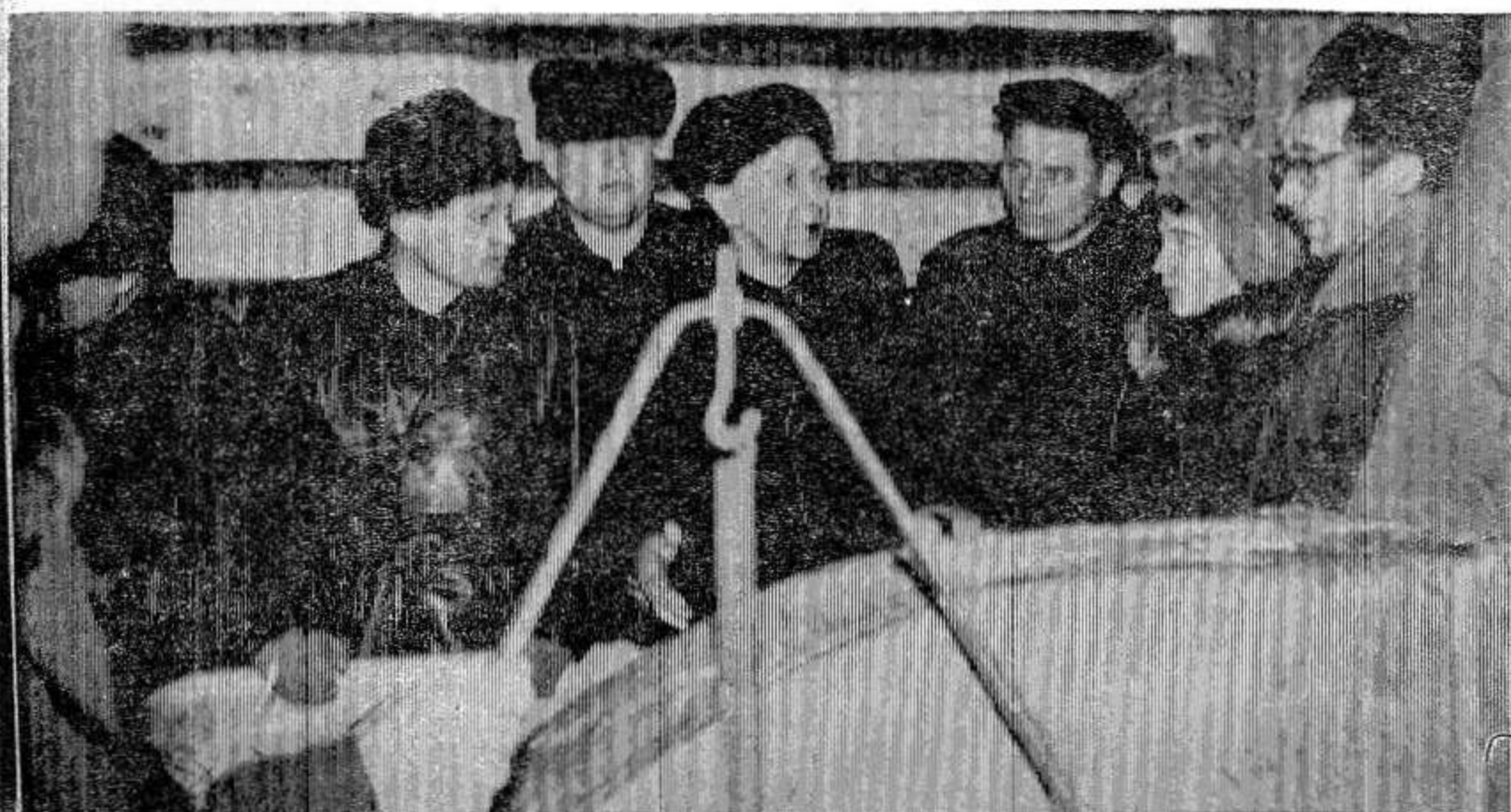
На снимке: участники заседания совета знакомятся с порядком приготовления соломы к скармливанию в совхозе «Глубоковский».