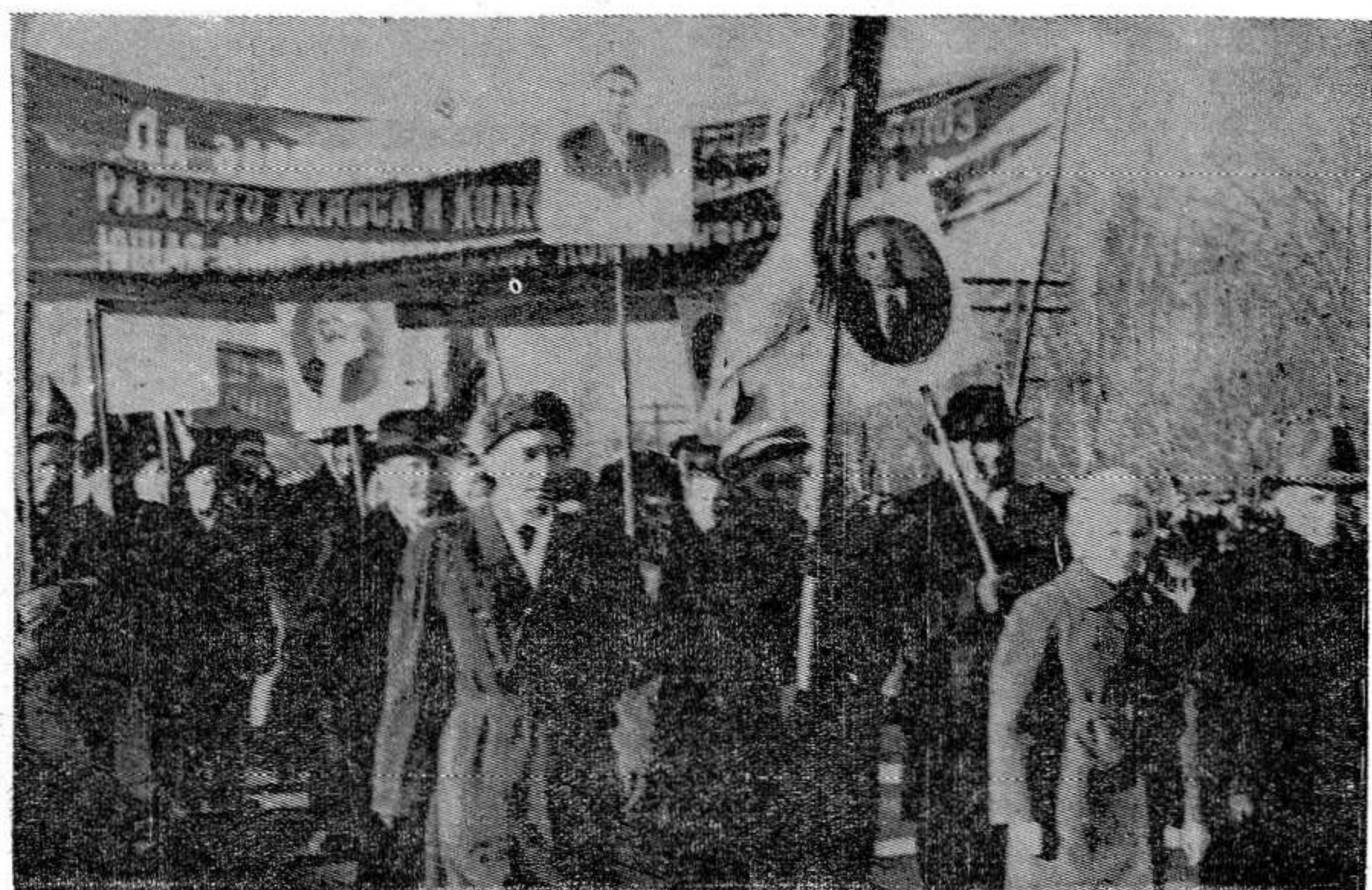
Опочка, 7 ноября 1962 года. Одна из колонн праздничной демонстрации трудящихся на Советской площади.

До позднего вечера продолжались торжества.