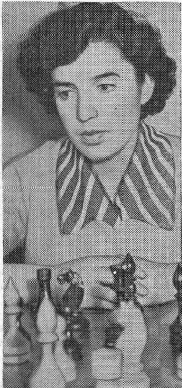
НОНА ГАПРИНДАШВИЛИ — ЧЕМПИОН МИРА ПО ШАХМАТАМ

Матч на первенство мира по шахматам между Елизаветой Быковой (Москва) и Ноной Гаприндашвили (Тбилиси) завершился убедительной победой молодой грузинской шахматистки (ей лишь недавно исполнился 21 год). Соперницам предстояло сыграть 16 партий. Интересно, что Гаприндашвили сыграла всего лишь две «лишние» партии, закончив соревнование уже на одиннадцатой встрече со счетом 9:2.