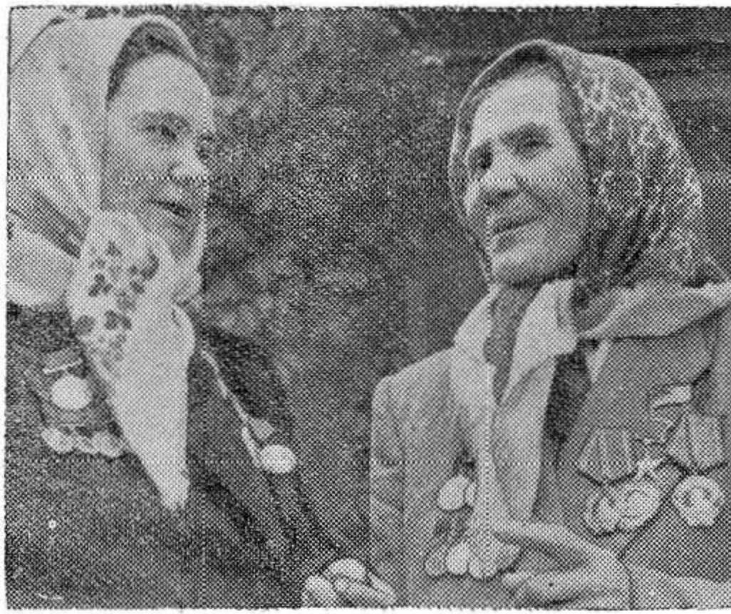
ЖИТОМИРСКАЯ ОБЛАСТЬ. В