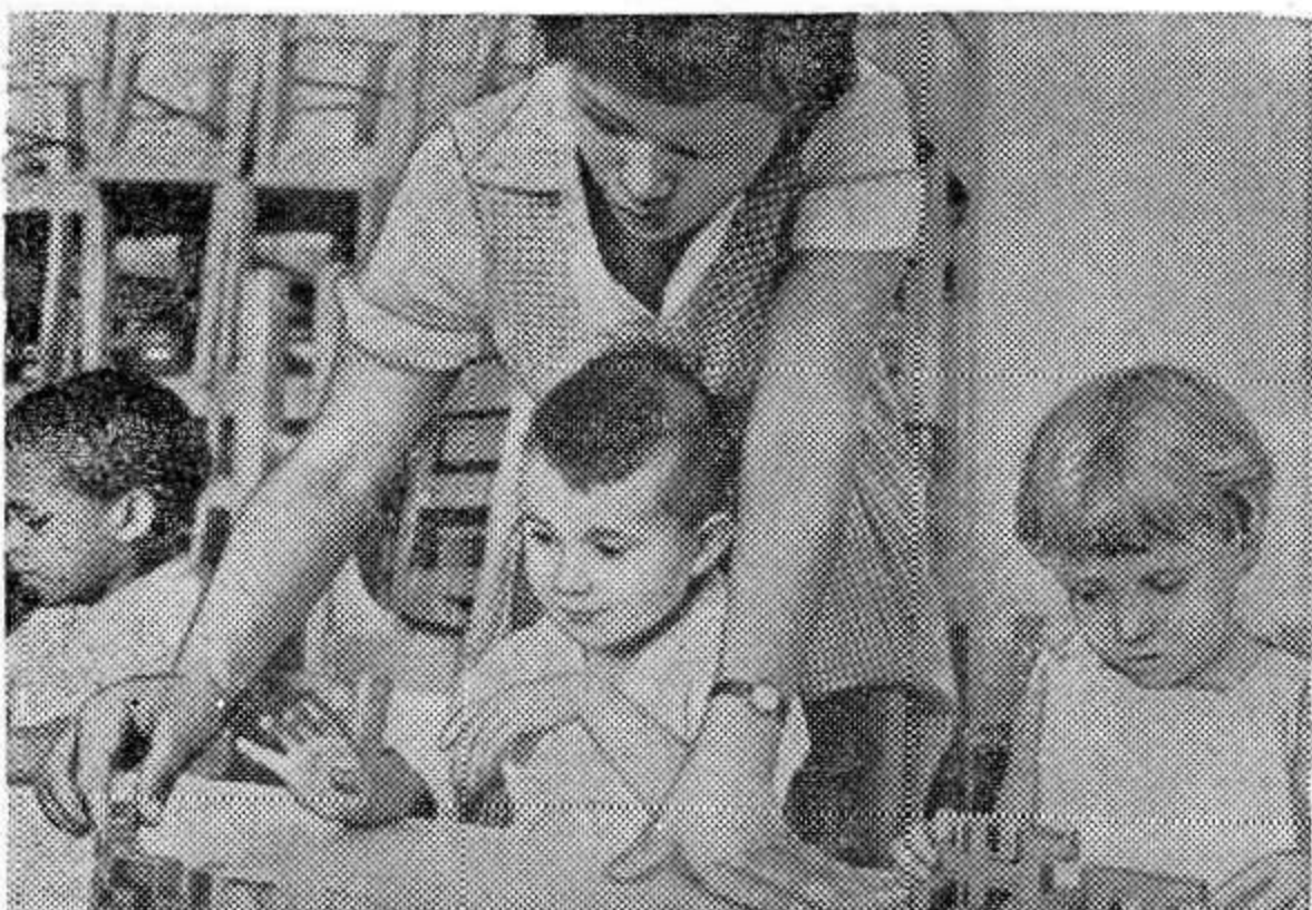
Вниманием и заботой окружил кубинский народ свое молодое поколение. Для малышей созданы детские сады и ясли, где они находятся под наблюдением воспитателей, пока их матери заняты на работе. На снимке: в одном из детских садов Гаваны.

за... ни... ки... спе... ла... ми... XX... но... кру... луч... за... тив... эко... совх... знач... тия... чело... рядо... Бс... лого... го. О... пров... вал... ми. Э... тино... устро... резул... го ста... Жи... где... конкр... предсе... совхоз... хозяйс... вилд, г... При... седател... к комм... всей с... тыре г... жок по... номики... пропага... лов отн... тельно... тию. И... шателей... человек... довые к... Прие... 26 сен... нистана... Централь... Председат... Союза СС... Тепло... трудящие... гостя —... тельства... шени в к... зданиями... флаган Сов... ССР. Па аэро... ва встрети... ЦК КП Тур... зов, предсе... Сердеч... 25 сентя... ственное за... народного... Председател... ного Совет... провозглаше... нием Белгр... Л. И. Бре... дарит Народ... своение ем... гражданина... дружеские с... заседании в... юза. Председате... ховного Сове... ич Брежнев... торжественн