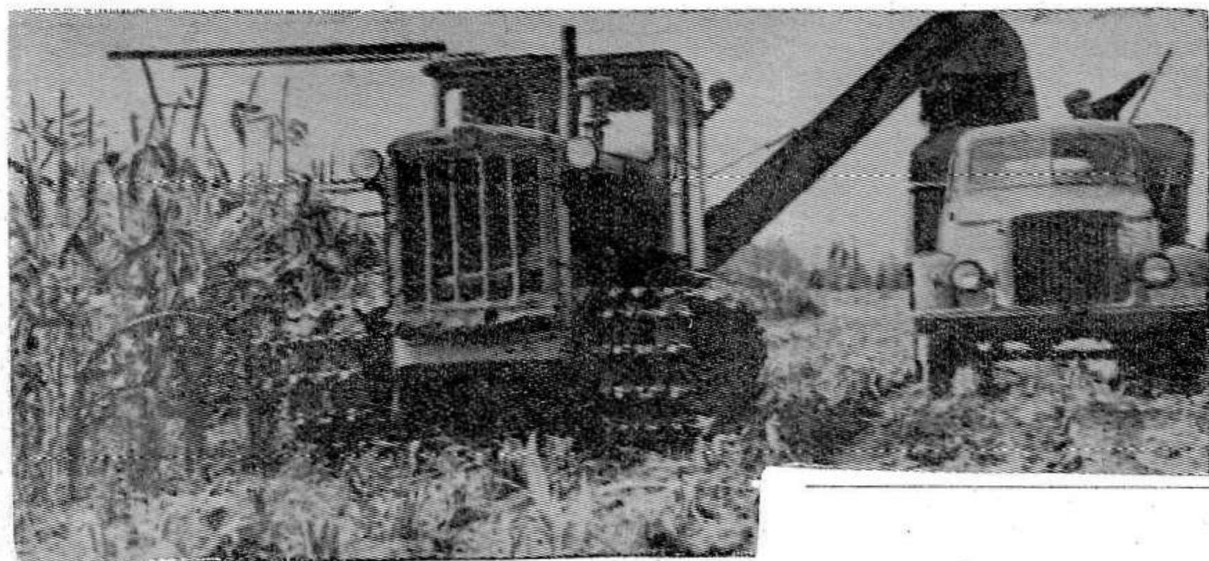
На 10 гектарах неплохая кукуруза выращена в отделении Петровское совхоза „Красный фронтвик“.

На снимке: уборка кукурузы силосоуборочным комбайном.