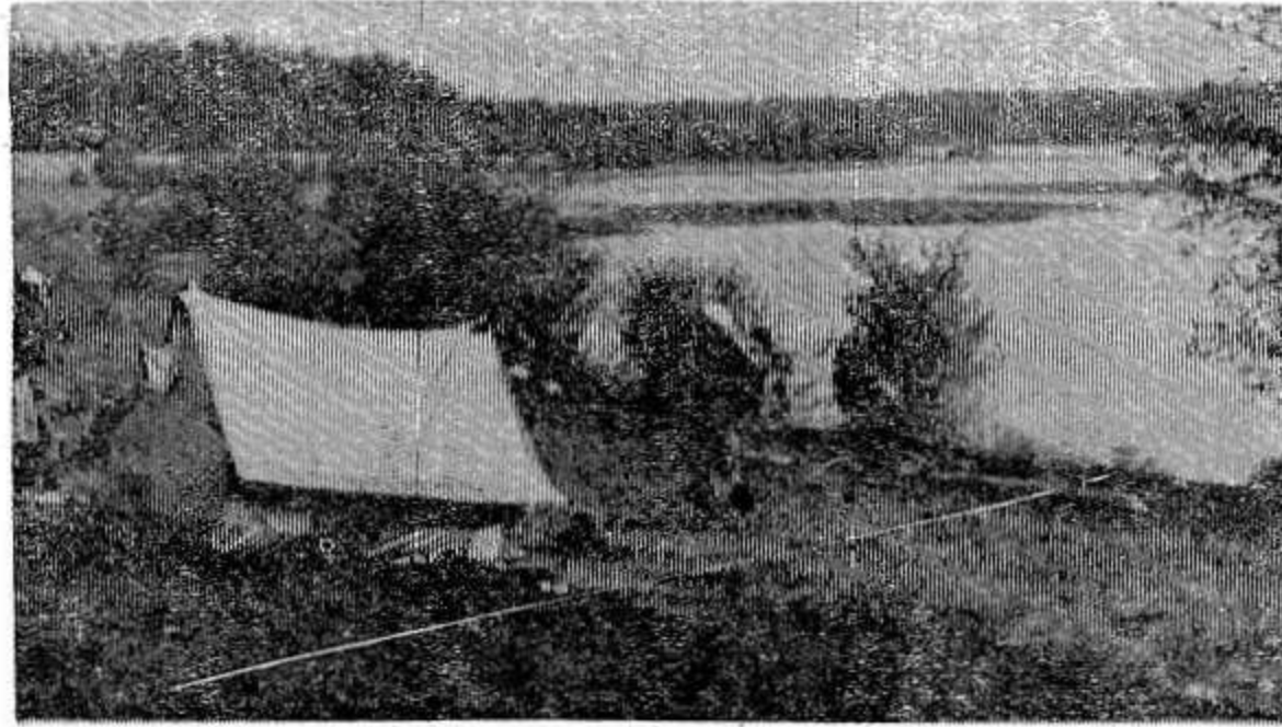
НА СНИМКЕ: в туристическом походе по родному краю. Привал на берегу реки Великой.