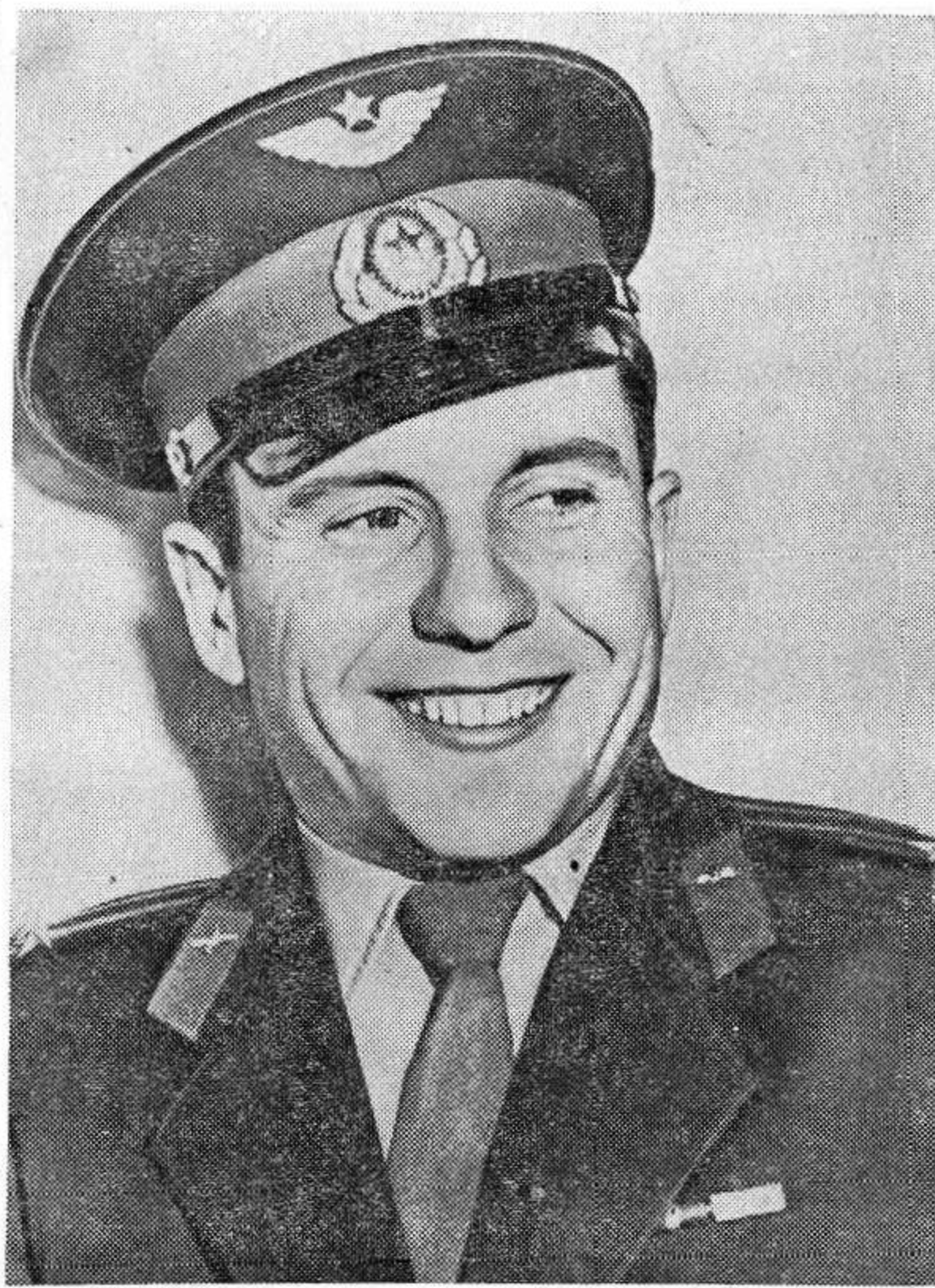
Космонавт П. Р. Попович

Павел Романович Попович родился 5 октября 1930 года в поселке Узин Киевской области в семье рабочего. По национальности — украинец.