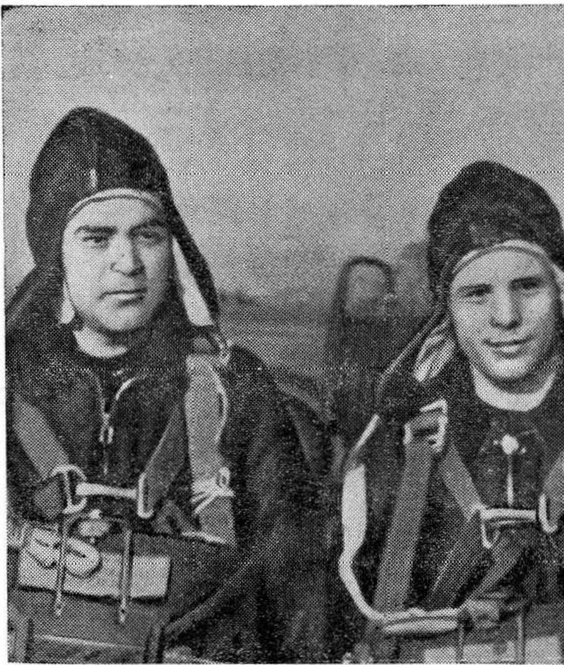
Летчик-космонавт майор Андрей Григорьевич Николаев и Герой Советского Союза летчик-космонавт майор Ю. А. Гагарин на тренировке.