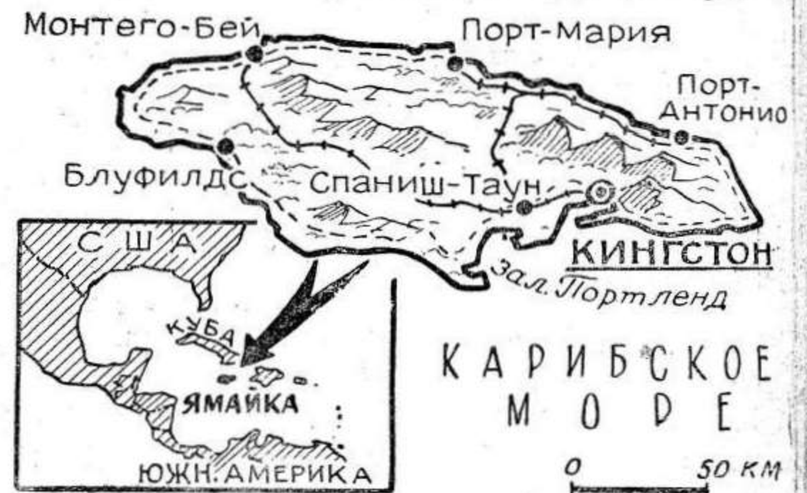
Рис. А. Ведерникова.