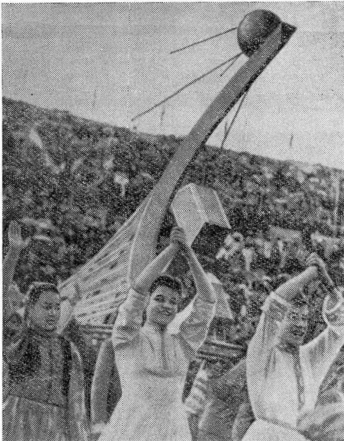
Хельсинки. Открытие VIII Всемирного фестиваля молодежи и студентов «За мир и дружбу». На снимке: делегация Советского Союза проходит по Олимпийскому стадиону. (Принято по фототелеграфу).

3 Одна публ загот гих но м потре вит сложи уборк культ бить ние г общес Решет вышег четкой Ни од падат ность льно- косилк машин Хорс загото пятидн Красн рост состав но вел колхоз на, «В хозяйст жинско ку загс за все загот пц На колхоз Себежск На стра Свобода Имени Л Путь Л Новая Новый п Родина Труд Восход Россия Пламя Имени Ча Победа Завет И Память Красный Вперед Дружба Красного Борец Новая ж Имени Дз Имени Ми Вперед Гранит Дружба Рассвет Красный Светлый Большеви Россия Память И Прим сена и силс кормов по