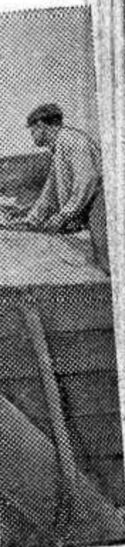
амокормуш- ный свинарь г 2 тысячи ханизирован- ек на свино- ек». Байдолова.