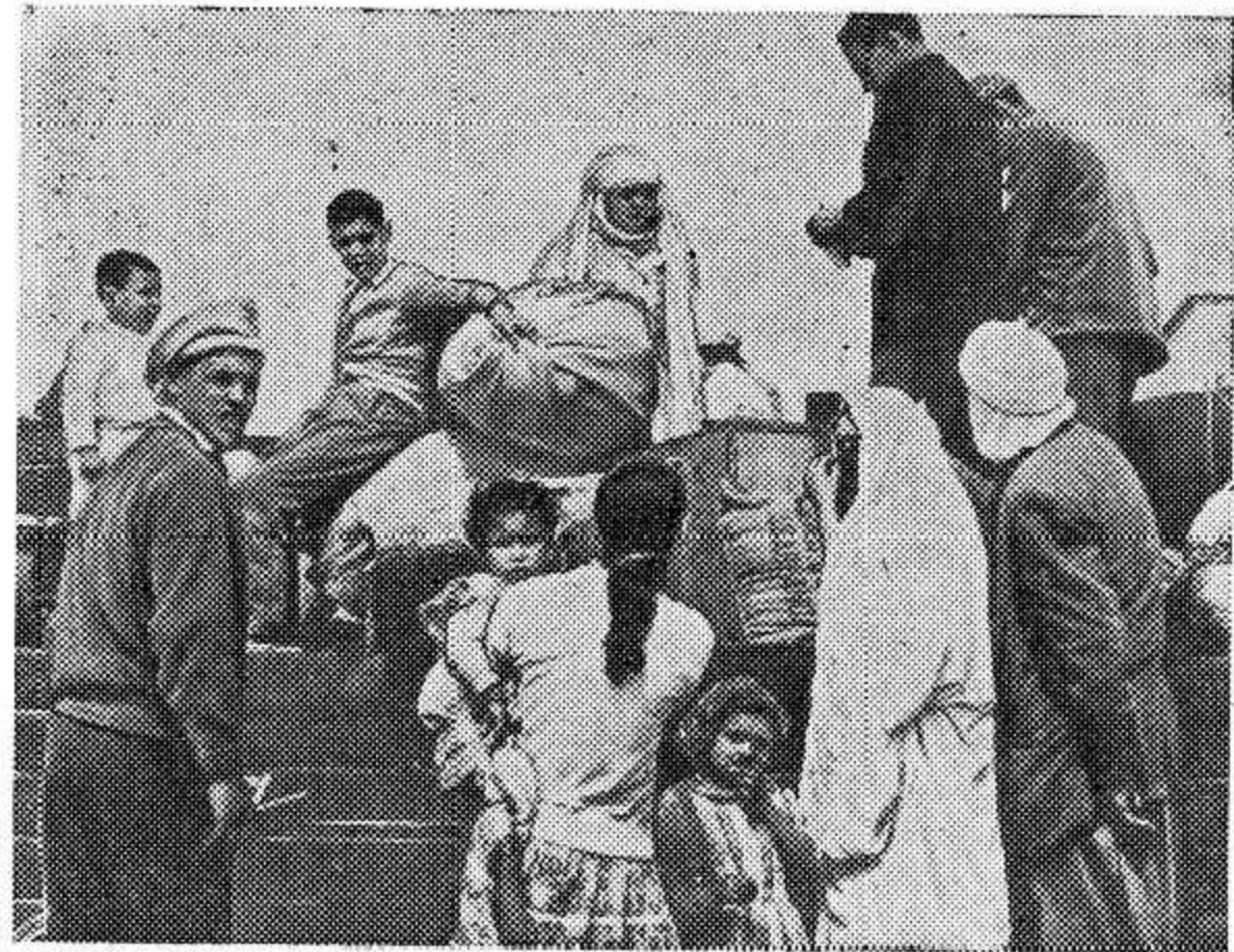
Газета выходит по вторникам, четвергам, пятницам и воскресеньям.

По данным бюро погоды, в районах территориального производственного управления 1 и 2 августа ожидается небольшое повышение температуры воздуха, местами кратковременные дожди.