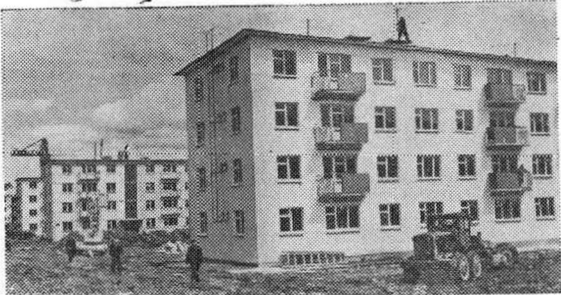
МОСКОВСКАЯ ОБЛАСТЬ. В совхозе «Заря коммунизма» Подольского района продолжается строительство первого опытного агрогорода. В одном из шестидесятиквартирных домов уже поселились первые жильцы. Готовится к сдаче еще один дом, в трех других идут отделочные работы.

(Журнал «Венгерские новости» № 4, 1962 г.)