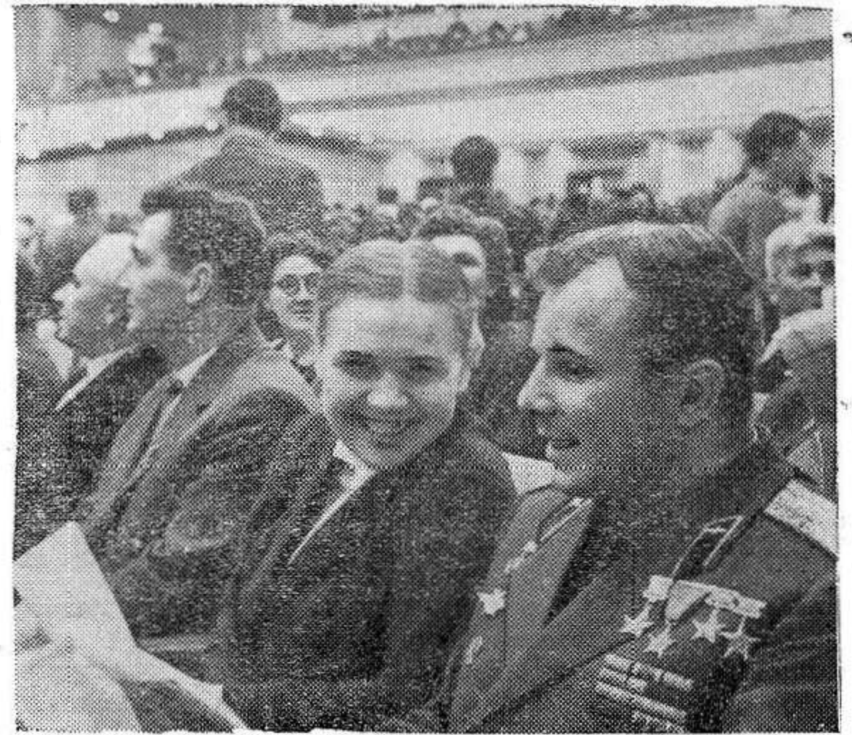
Москва. Кремлевский Дворец съездов. Всемирный конгресс за всеобщее разоружение и мир.