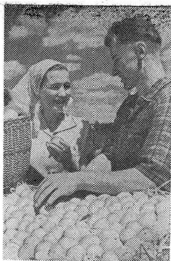
КУРСКАЯ ОБЛАСТЬ. Колхоз имени Пушкина Фатежского района первым в области досрочно выполнил план продажи яиц государству и начал отправку продукции в счет будущего года.