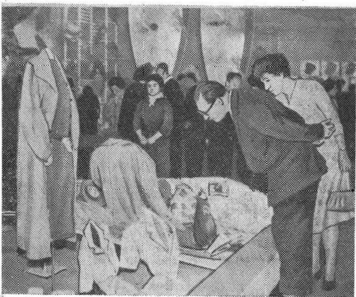
Москва. В Центральном выставочном зале открылась Всесоюзная выставка одежды, обуви, трикотажных и меховых изделий.