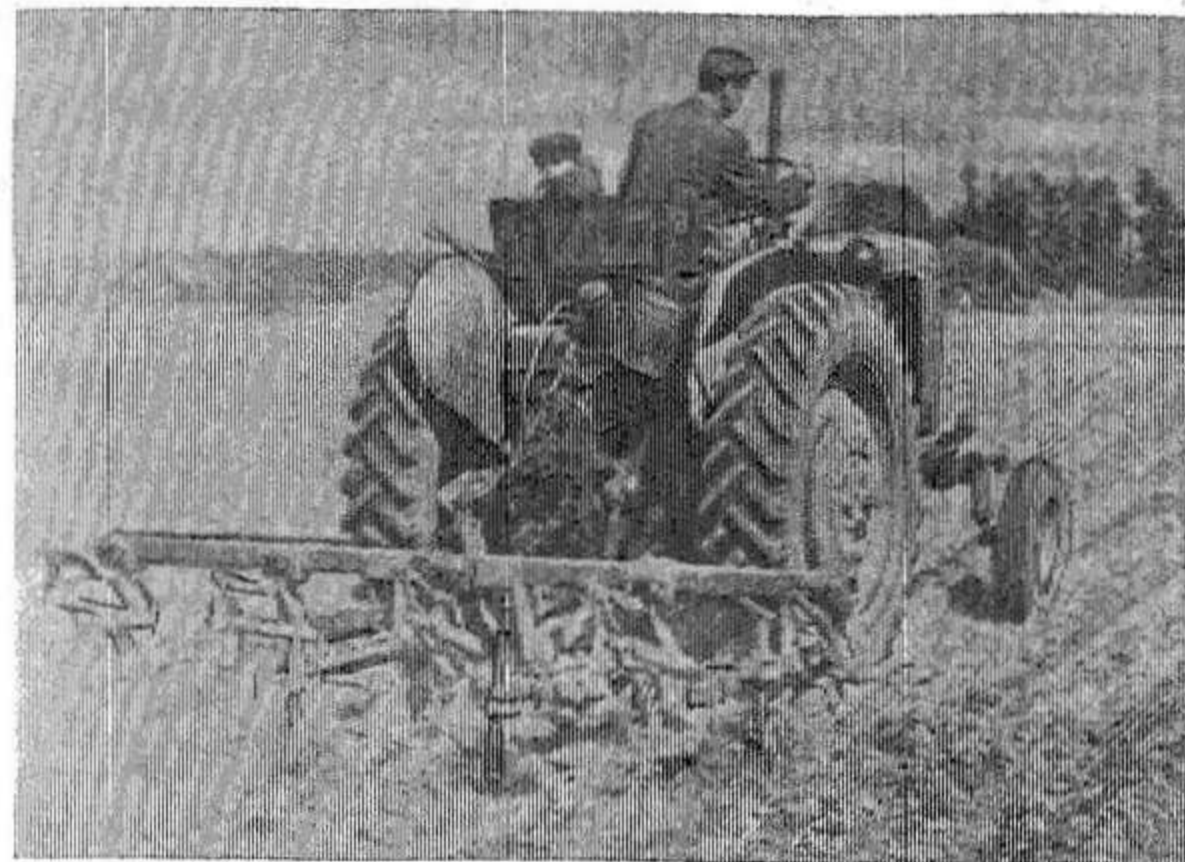
Механизаторы сельхозартела «Большевик» Красногородского района ведут борьбу за получение высокого урожая пропашных культур. Сейчас на всех участках хорошо пошла в рост кукуруза и сахарная свекла. На свеклович-