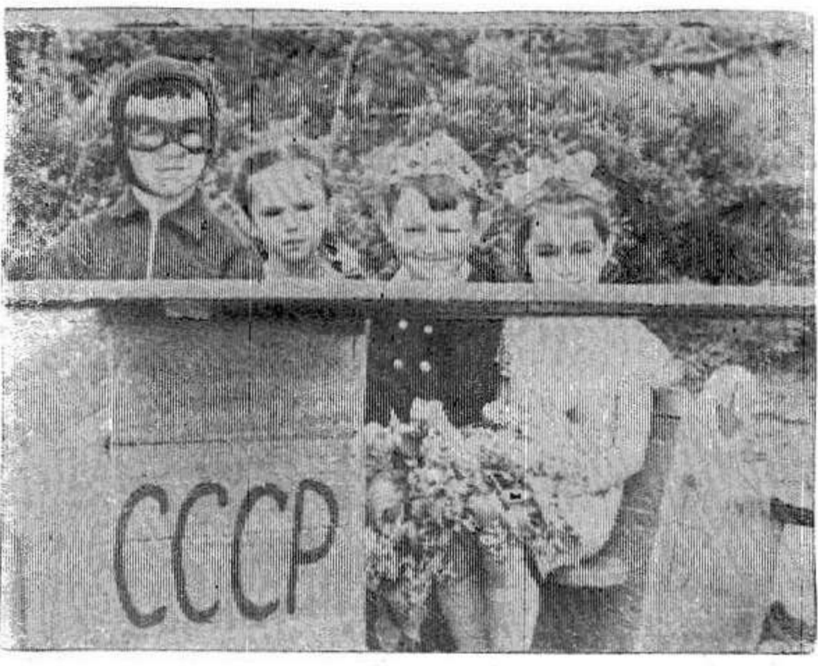
Дорога в космос начинается так...