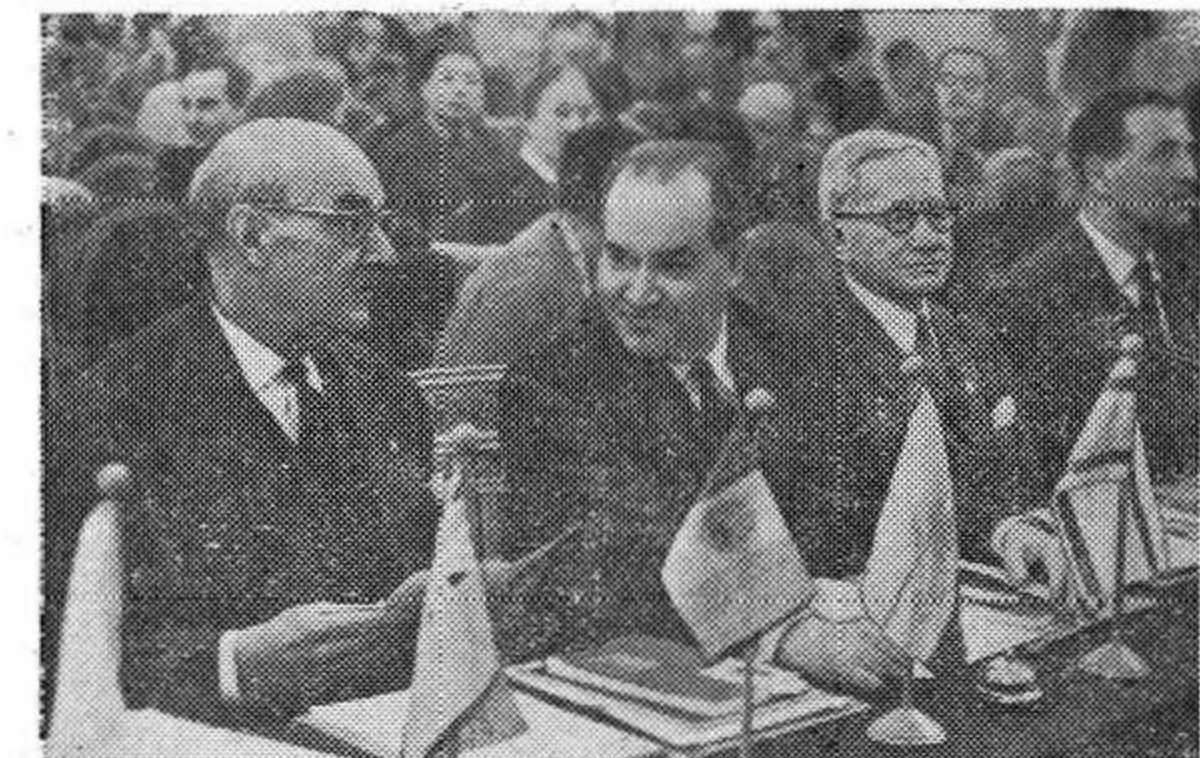
МОСКВА. Началось прослушивание музыкантов-участников II Международного конкурса пианистов, скрипачей и виолончелистов имени П. И. Чайковского. НА СНИМКЕ: жюри конкурса скрипачей. Слева направо — Дж.

рабочие для работы на торфопредприятии. Одновременно предоставляется общежитие.