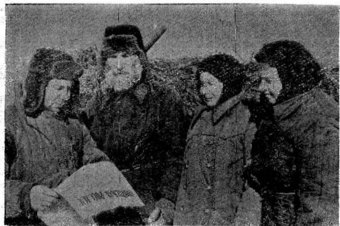
Мартовский Пленум ЦК КПСС указал, что существующая структура управления сельским хозяйством не отвечает возросшим требованиям. Сейчас в стране организуются новые органы управления. Наш фотокорреспондент запечатлел момент, когда колхозники одиннадцатой бригады сельхозартели «Вперед» знакомятся с постановлением ЦК КПСС и Совета Министров СССР «О перестройке управления сельским хозяйством».

РО менес 4 цен на пл лучит сельх Степа весна товле местн О лись долго мереш руках все э когда итоги столь нбвая ки... ника. ланна. дня. хоза. шести Та Анатх Заниг а инк рам бороз жал страс сесть пока: ку. Ж: плоти учил хозяй ских Наст всем чил за р: взят ла н: «Что Пуст выпо наст моло ренн не помо мног окон ние Х: с то живи чи т тора — сове рект рую Д: трак и дс лий тыв: «Кр: