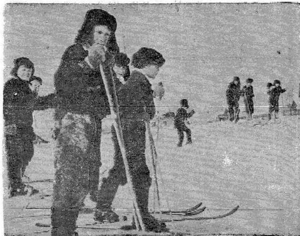
НА СНИМКЕ: учащиеся четвертой средней школы на лыжной прогулке.