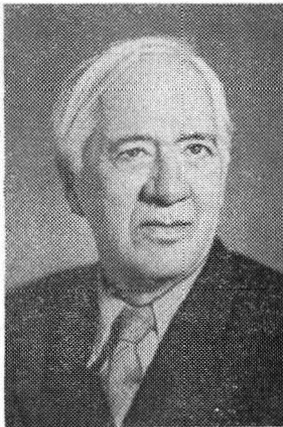
Советский писатель К. И. Чуковский.

Художественный фильм «ПОДВИГ РАЗВЕДЧИКА». Начало сеанса в 15 часов.