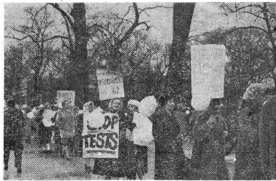
СОЕДИНЕННЫЕ ШТАТЫ АМЕРИКИ. Более двух тысяч женщин Вашингтона, Нью-Йорка, Филадельфии, Балтимора, а также делегации женщин из штатов Калифорния, Огайо, Массачусетс приняли в середине января участие в демонстрации перед Белым домом в Вашингтоне. Массовая демонстрация женщин явилась