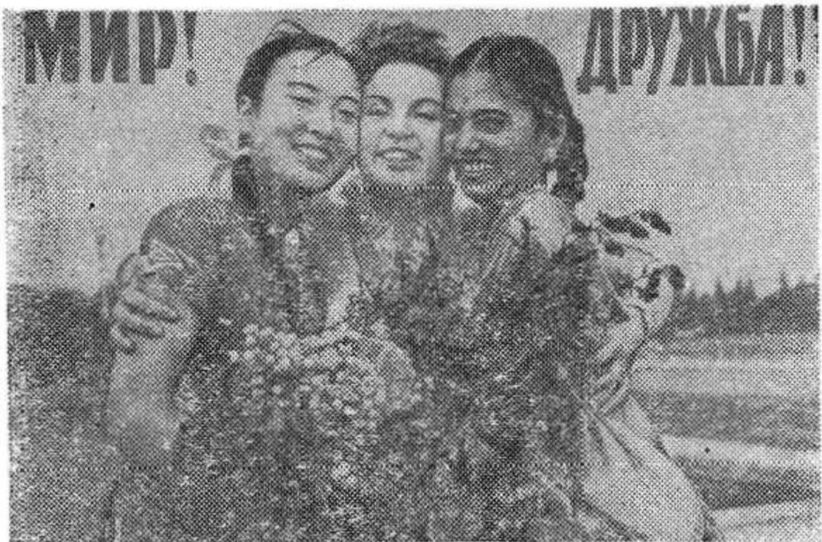
Плакат художника А. Устинова (ИЗОГИЗ).