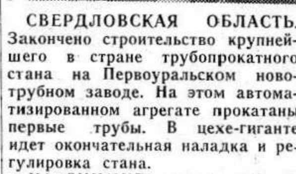
СВЕРДЛОВСКАЯ ОБЛАСТЬ. Закончено строительство крупнейшего в стране трубопрокатного стана на Первоуральском новотрубном заводе. На этом автоматизированном агрегате прокатаны первые трубы. В цехе-гиганте идет окончательная наладка и регулировка стана.

Передовая статья нацеливает колхозников на решение новых больших задач. Нынче под посевами кукурузы будет занято более 100 гектаров. Значительно увеличиваются посевы зернобобовых культур, сахарной свеклы. Понятно, что пропашные культуры требуют большого количества органических удобрений. Чтобы получить хороший урожай этих культур, запланировано вывезти на поля 14 с половиной тысяч тонн органических удобрений. А вывезено их немногим более 5 тысяч