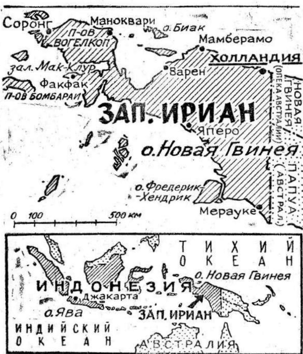
Карта Индонезии и Западного Ириана.