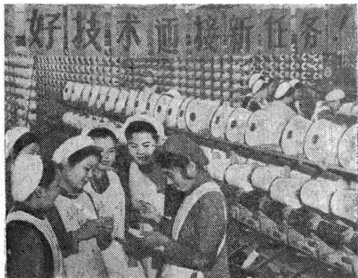
КИТАЙСКАЯ НАРОДНАЯ РЕСПУБЛИКА. Коллектив хлопчатобумажной фабрики № 2 в Пекине досрочно выполнил план прошлого года. Сейчас текстильщицы фабрики успешно выполняют задание 1962 года.

Не забудьте подписаться на свою районную газету!