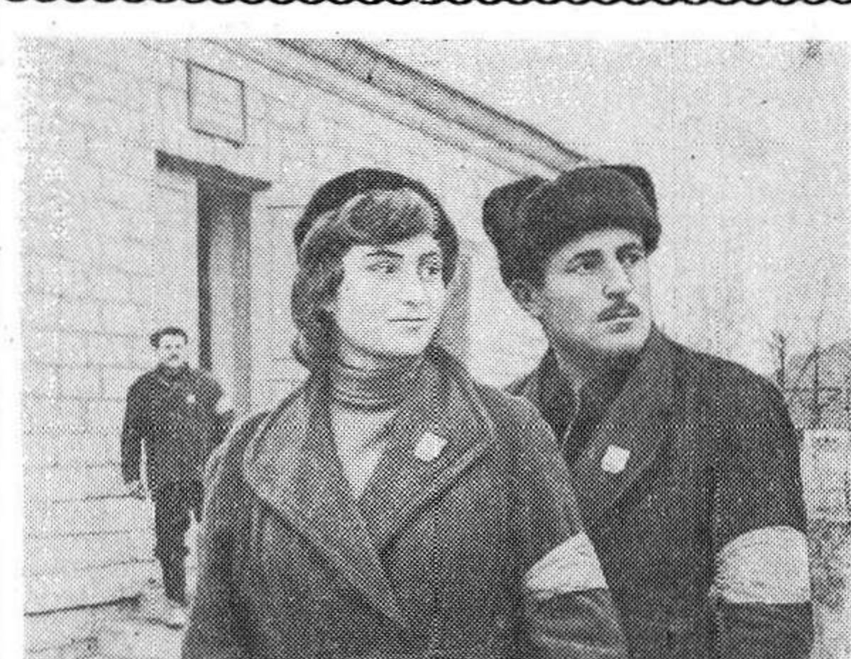
ДАГЕСТАНСКАЯ АССР. Совхоз имени Алиева, Дербентского района, — передовое хозяйство. Ему первому в республике присвоено звание коллектива коммунистического труда.

В поселке совхоза решили отказать от услуг милиции. Охрану общественного порядка здесь