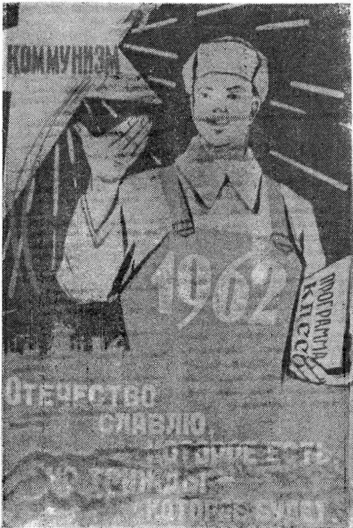
Плакат художника Б. Антонова.